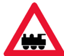
Jernbaneoverkørsel uden bomme